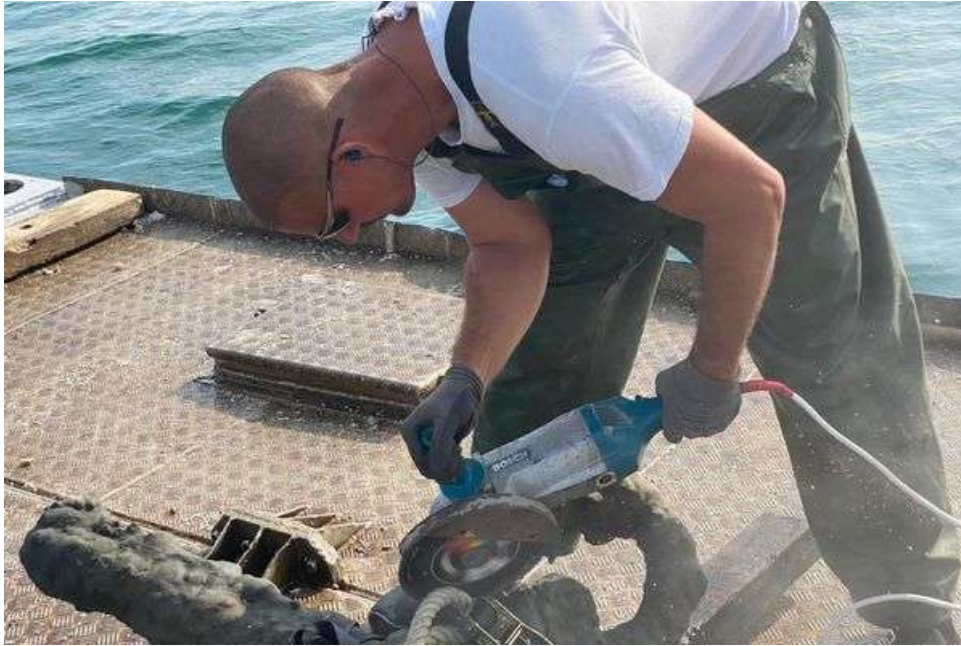
L'ancre est disquée pour ne prélever que l'organeau qui sera confié au CEA

Pour réaliser cette datation, ils vont faire appel au CEA, le Commissariat à l'Energie Atomique, qui utilisera la célèbre technique du carbone 14. Une technique éprouvée mais pas sur le métal. Le carbone 14 est en effet plus facilement utilisé pour dater des bois, des tissus ou des végétaux.