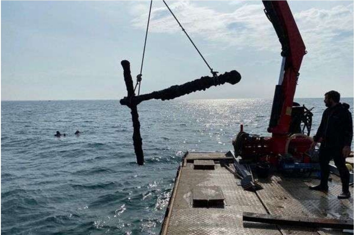
L'ancre remontée du fond à l'aide d'une barge