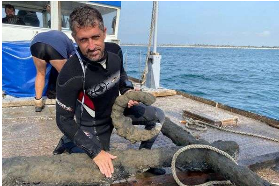
L'organeau qui sera envoyé au CEA à Paris pour une datation au carbone 14

Ces ancres, s'il s'avère que ce sont des ancres gènoises et non romaines étaient entourées de cordage sur "l'organeau".