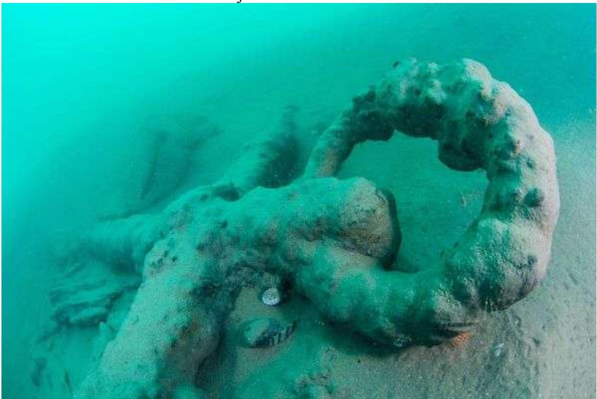
L'ancre retrouvée par les archéologues du GRAN parlera t-elle?

Publié le 18/09/2020 à 08h01 • Mis à jour le 18/09/2020 à 23h15